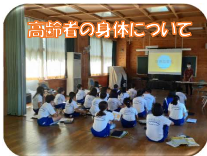
高齢者の身体について

昨年9月に蓬萊小学校の5年生に高齢者体験と認知症サポーター養成講座を、11月には蓬萊東小学校の5年生と6年生に講座を行いました。蓬萊東小では保護者協力を得て寸劇も行い、子供たちに認知症についてを身近に感じてもらうことができました!