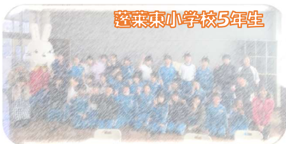
蓬萊東小学校5年生