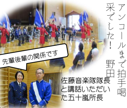
先輩後輩の関係です