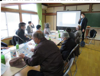
10月28日 終始笑顔で行われた講話