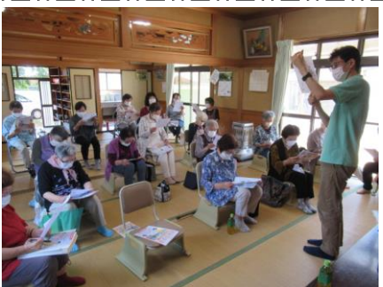
6月10日 わわわの会 講話の様子

運動や外出がなかなかできない中で「フレイル予防」について、講話をさせていただきました。フレイルのセルフチェックを一緒に行った際、ほとんどの方がフレイル予備軍に当てはまりましたが、予防に関する話を熱心に聞いたり、体操に参加したりと積極的にフレイル予防に取り組まれています。