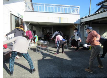
1月18日 ラジオ体操の様子

体力測定の結果が開始 当初よりも向上してい るのはもちろん、毎週 の体操が習慣となり、 外出や交流のきっかけ につながっていること を改めて感じることが できました。左藤ゆ