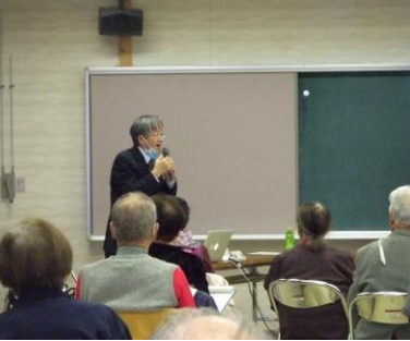
12月12日の清水支所 二階

南沢又西げんき会 いきいきももりん 体操 体力測定 東の間の晴れ間がみ えた一月中旬。西げん き会で体力測定を行 いました。西げんき会 は、ラジオ体操ともも りん体操を屋外で実施 しています。 十月に体操を開始し 三か月経過後の測定と なりました。皆さんは つらつと取り組んでお られました。若島