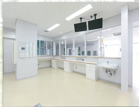
1F ナースステーション