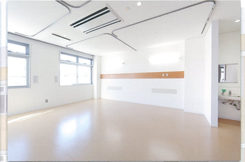
東病棟 2F 病室(1床当たり8㎡)