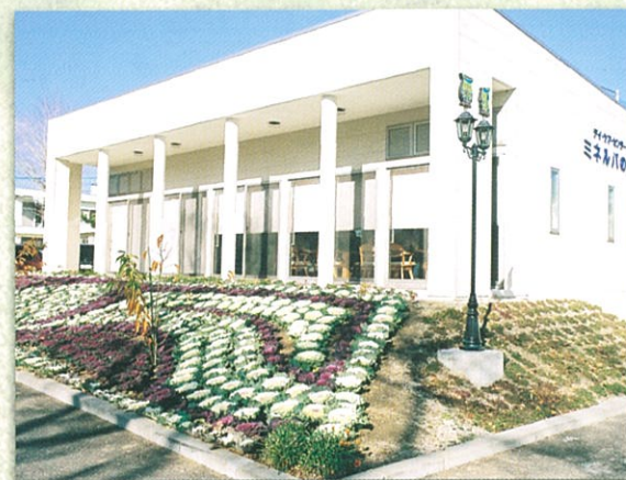
デイケア ミネルパの丘