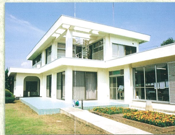
作業療法センター