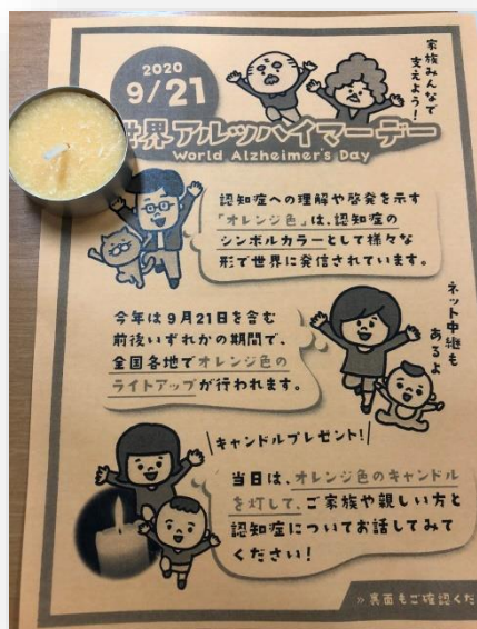
アロマキャンドルと案内ちらし(表)